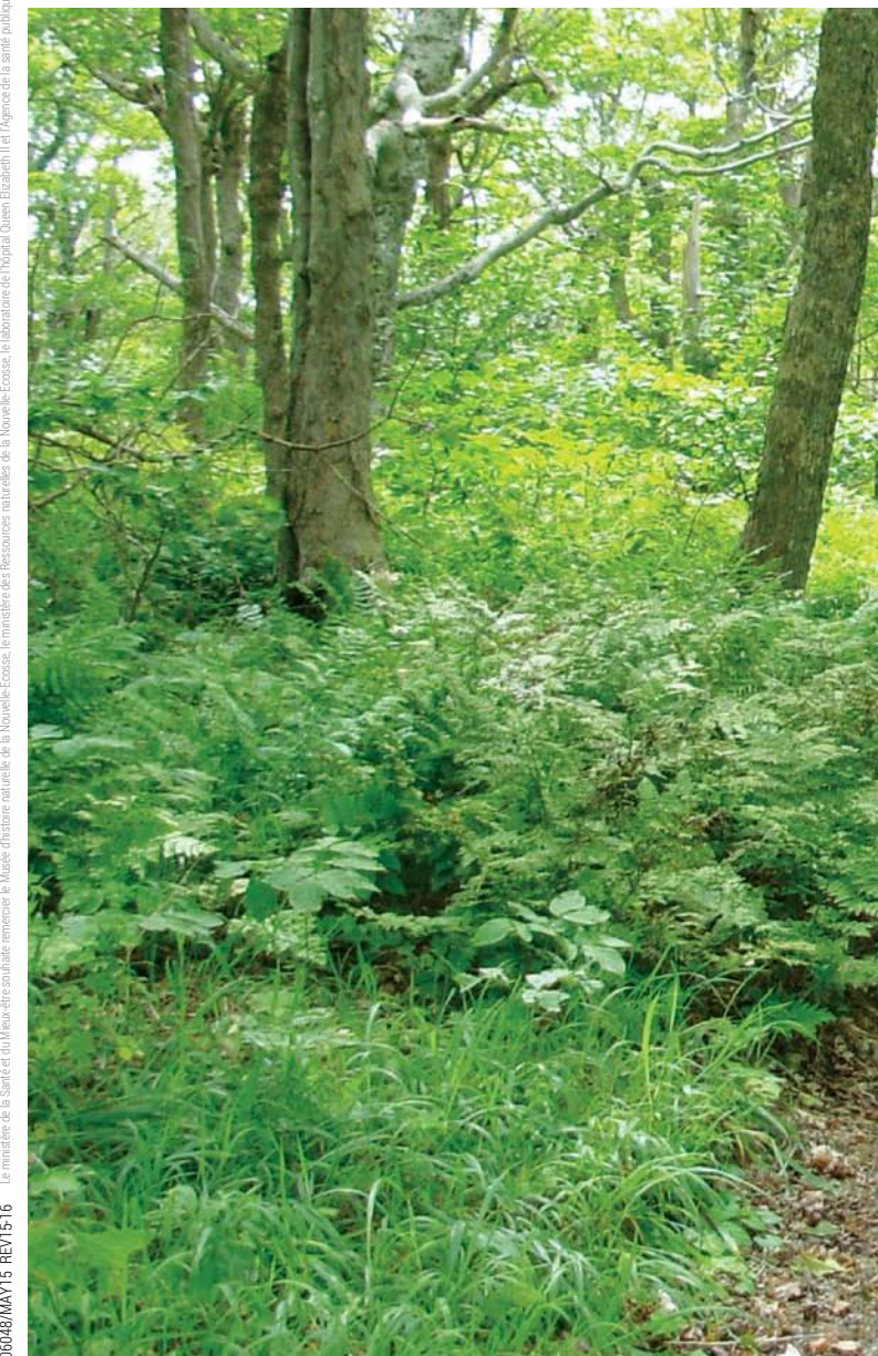
Le ministère de la Santé et du Bien-être souhaite remercier le Musée d'histoire naturelle de la Nouvelle-Écosse, le ministère des Ressources naturelles de la Nouvelle-Écosse, le laboratoire de l'Hôpital Queen Elizabeth II et l'Agence de la santé publique du Canada pour leur contribution à la création de cette brochure.