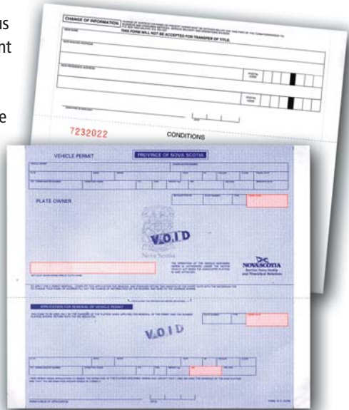
Permis de véhicule