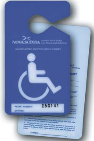
Carte de stationnement pour personnes à mobilité réduite

Si vous êtes une personne à mobilité réduite et que vous possédez et conduisez régulièrement un véhicule automobile, vous pouvez obtenir une plaque d'immatriculation spéciale à l'intention des personnes à mobilité réduite. La plaque spéciale qui vous est remise est assignée à votre véhicule. Vous pouvez aussi obtenir une carte de stationnement qui peut être utilisée dans n'importe quel véhicule en autant que le titulaire de la carte est à bord du véhicule. La carte doit être suspendue au rétroviseur lorsque le véhicule est stationné dans un espace désigné. Elle devrait être enlevée du rétroviseur avant de reprendre la route. Si vous stationnez dans un espace désigné sans avoir une plaque ou une carte de stationnement pour personnes à mobilité réduite, vous êtes passible d'une amende. En outre, votre véhicule peut être saisi et remorqué.